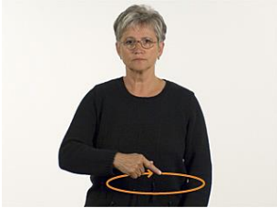
möge uns begleiten.